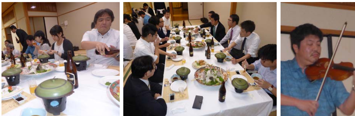
—大分統計談話会 56 回大会・情報交換会でのひとこま—