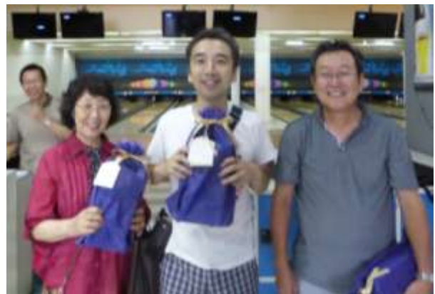
—ボウリング大会でのひとこま—