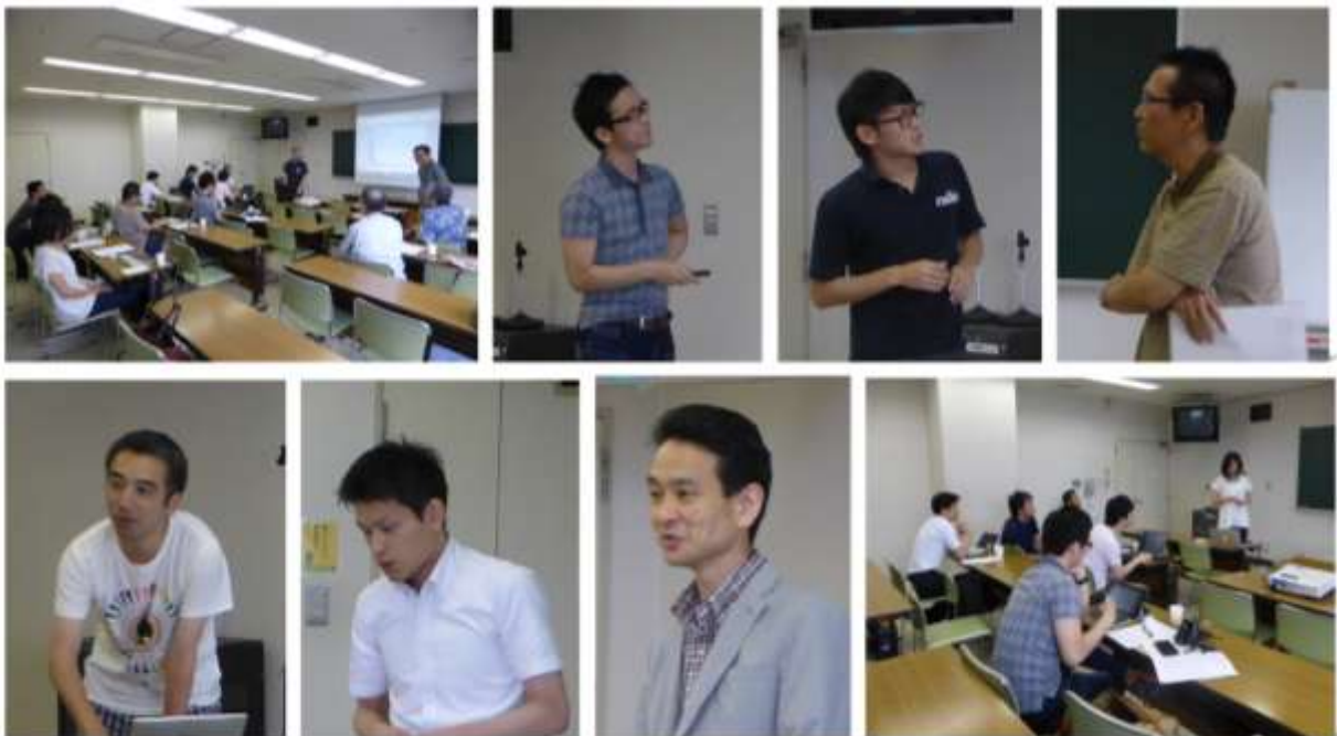
—シンポジウムでのひとごま—