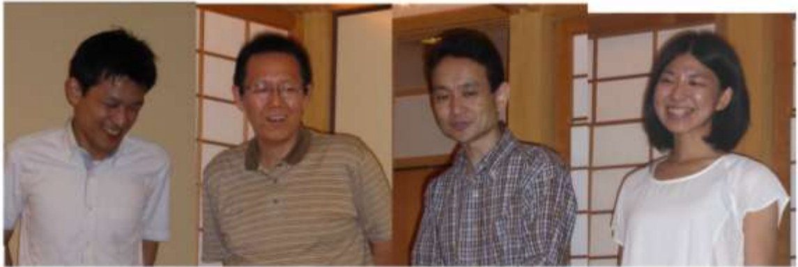
—懇親会でのひとこま—

③ (1)特定主題セミナー2015「臨床評価におけるデータマネジメントの過程」が以下の次第で開催されます[敬称略].