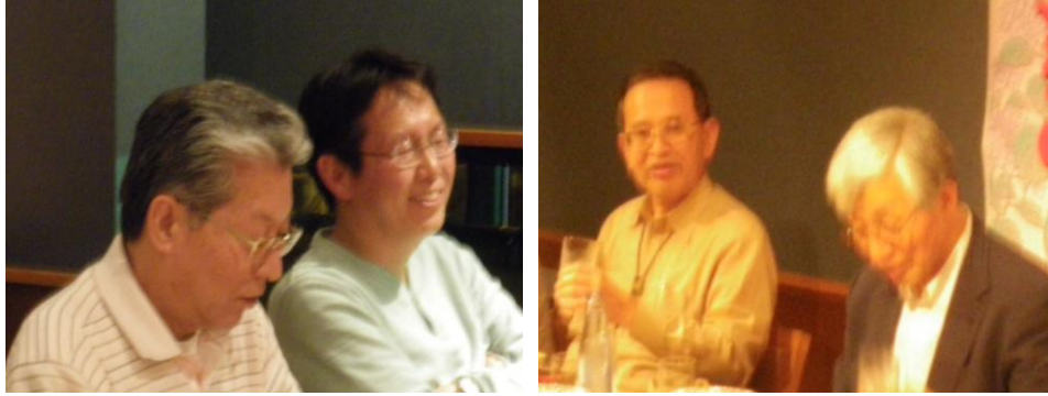
課題検討会でのひとこま

4 『医学統計研究会の現況,vol.6(平成 22 年度会報)』にてご報告いたしておりますが、6月から9月にかけての予定を以下に要約いたします。